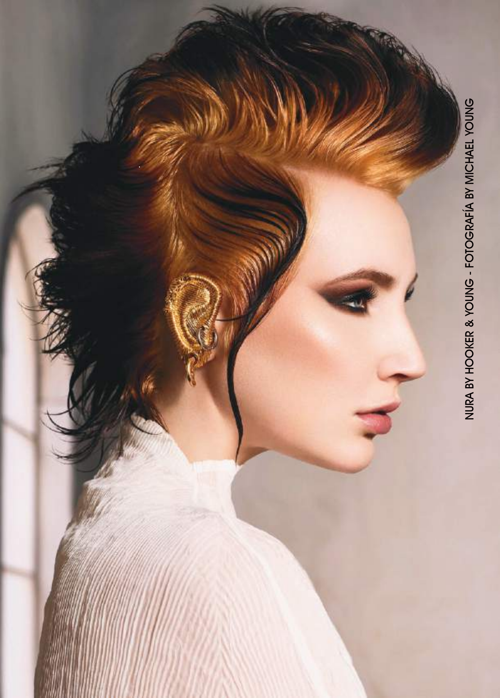
NURA BY HOOKER & YOUNG