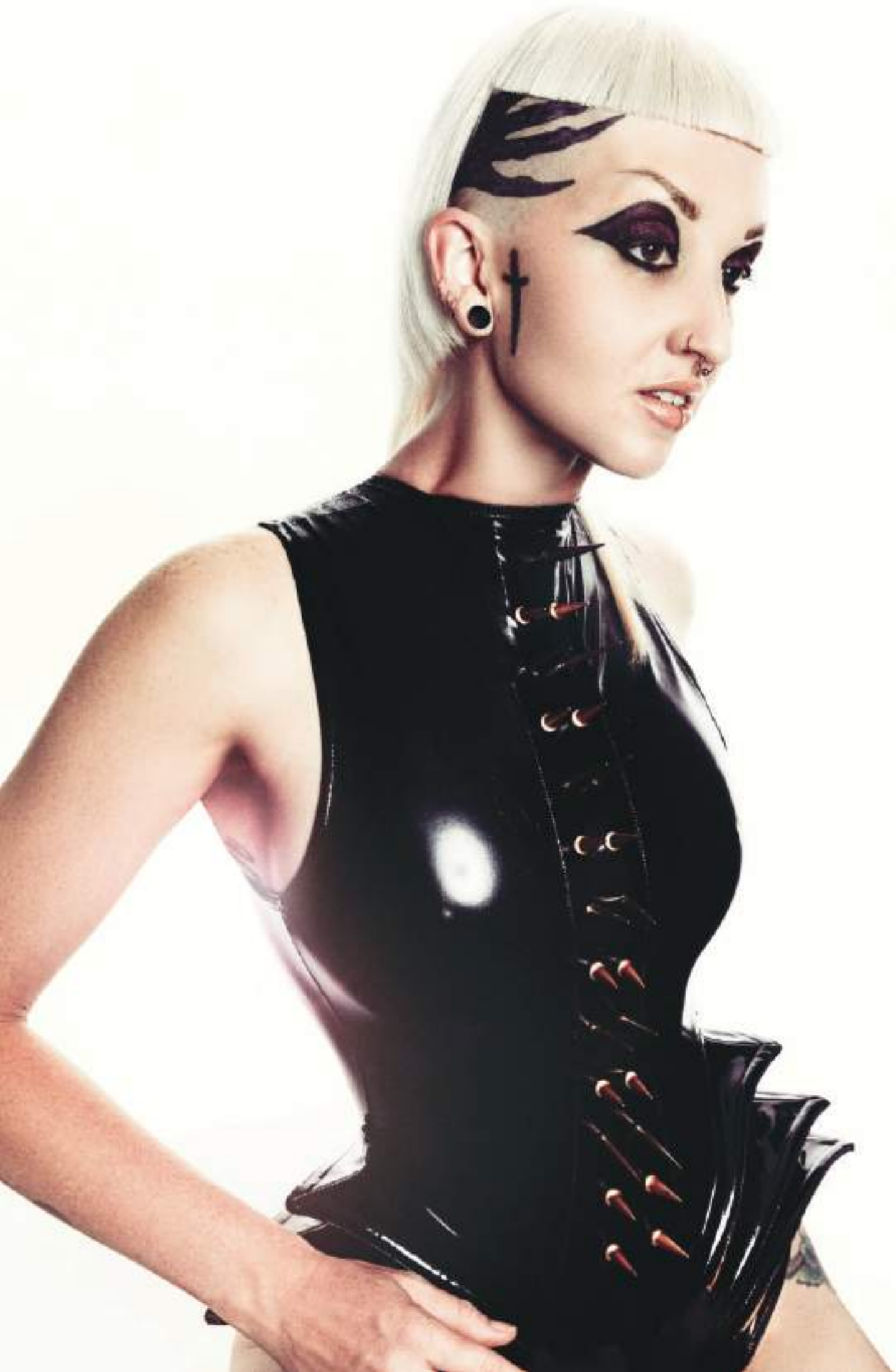
JIGSAW BY DANIELLE BLAKELEY, YOSHIKO HAIR