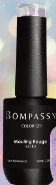
B5110 Mouling Rouge