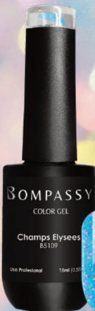
B5109 Champs Elysees